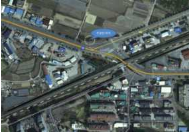
재해문자전광판 신규 설치(대곡삼거리)