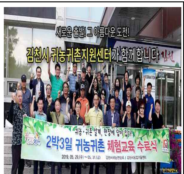
2박 3일 귀농귀촌 체험교육으로 인구유입 활성화